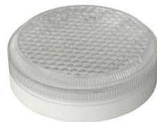
Исполнение 3, диаметр 180мм ЛУЧ-220-С 63, ЛУЧ-220-С 83, ЛУЧ-220-С 103 ~220В, 6/8/10Вт, 850/1050/1300Лм, 4000К (3000/5700 К под заказ)