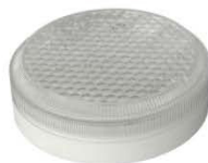
Исполнение 4, диаметр 150мм ЛУЧ-12-С 34/64, ЛУЧ-24-С 34/64, ЛУЧ-36-С 64, ЛУЧ-220-С 34/64, =12/=24/~36/~220В, 3/6Вт, 460/800Лм 4000К (3000/5700 К под заказ)