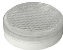
Исполнение 3, диаметр 180мм ЛУЧ-220-С 63, ЛУЧ-220-С 83, ЛУЧ-220-С 103 ~220В, 6/8/10Вт, 850/1050/1300Лм, 4000К (3000/5700К под заказ)