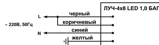
Рис.1. Схема подключения светильников постоянного действия