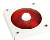
МАЯК-220-КПМ1-НИ оповещатель комбинированный, металлический корпус, наружное исполнение