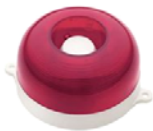
МАЯК-12-КП, МАЯК-24-КП оповещатель комбинированный