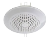
АРИЯ-10 П оповещатель речевой