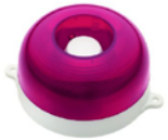
МАЯК-12-КП, МАЯК-24-КП оповещатель комбинированный