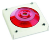
МАЯК-220-КПМ1-НИ оповещатель комбинированный, металлический корпус, наружное исполнение